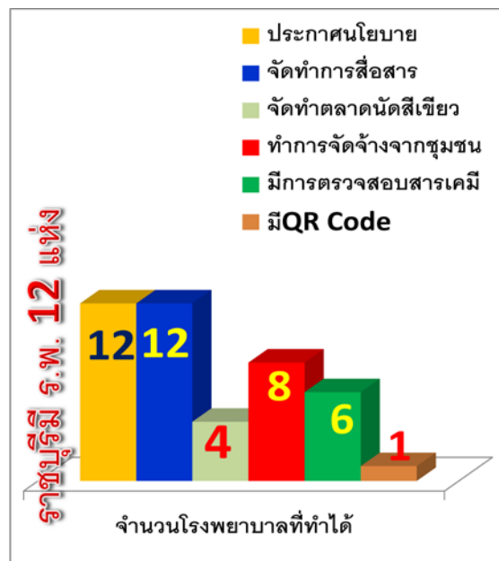
รูปที่ ๒ แสดงจำนวนผลการดำเนินงานอาหารปลอดภัยในโรงพยาบาลจังหวัดราชบุรี

จากนโยบายของเขต ๕ ให้ทุกโรงพยาบาลดำเนินงานอาหารปลอดภัย ราชบุรี มี ๑๒ โรงพยาบาล ได้มีการดำเนินงานตามเกณฑ์ โดยประกาศนโยบาย และสื่อสารได้ครบถ้วน ผลการดำเนินงานอยู่ในระหว่างการดำเนินงาน พบว่า มีการจัดทำตลาดนัดสีเขียว ๔ รพ (ร้อยละ ๓๓.๓๓) จัดจ้างซื้อผัก ผลไม้จากชุมชน ๘ รพ (ร้อยละ ๖๖.๖๗) มีการตรวจสอบการปนเปื้อนยาฆ่าแมลง ๖ รพ (ร้อยละ ๕๐) และมีการ ใช้ QR Code เพื่อสื่อสาร และตรวจสอบแหล่งผลิต เพียง ๑ รพ รายละเอียดดังรูปที่ ๒